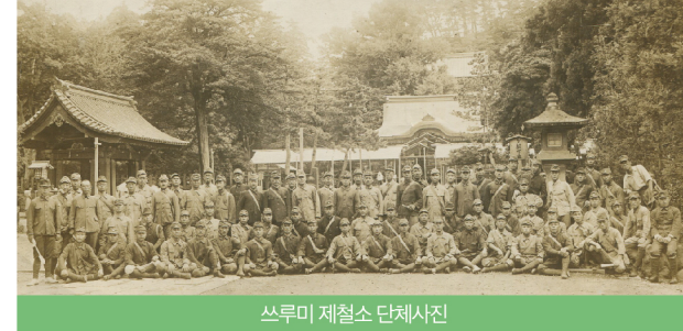
쓰루미 제철소 단체사진

일제 강제동원은 제국주의 일본이 만주사변(1931) 이후 태평양전쟁 말(1941~1945)까지 전쟁 수행을 위해 자행한 인적·물적 수탈 등을 의미합니다. 중일전쟁(1937) 장기화로 인해 본격적으로 이루어졌으며 수많은 사람들이 군인, 군속(군무원), 노무자, 일본군 ‘위안부’ 등으로 희생을 당했습니다.