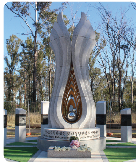
▲ 호주 블랙타운(2018)