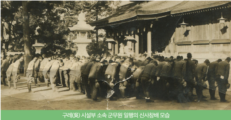
구례(吳) 시설부 소속 군무원 일행의 신사참배 모습

군속동원이란 육·해군에 복무하는 군인을 제외하고, 군노무자, 기타군무원(운전수, 포로감시원 등) 등으로 동원된 경우를 의미합니다.