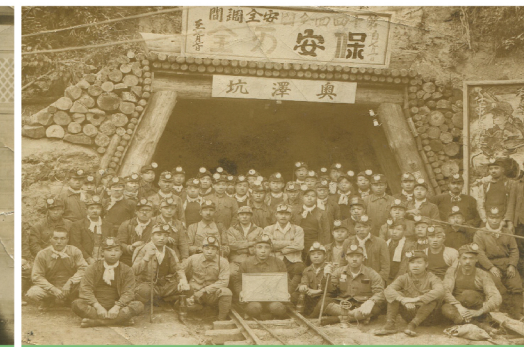
홋카이도 사쿠베츠[尺別] 탄광 오후사와 갱[澤]으로 동원된 노동자들