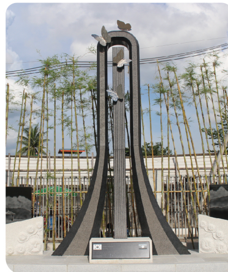
▲ 미안마 양곤(2017)