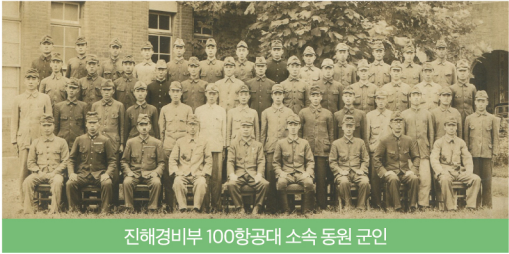
진해경비부 100항공대 소속 동원 군인

군인동원은 1938년 「육군특별지원병령」에 의해 직접적인 전쟁수행을 위한 동원을 의미합니다. 전쟁 중 많은 사람들이 사망하거나 행방불명 되었으며, 큰 부상을 입은 경우도 많았습니다. 대표적 동원지로 일본 오키나와, 남태평양 및 동남아시아의 여러 격전지가 있습니다.