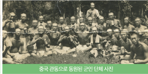
중국 관동으로 동원된 군인 단체 사진