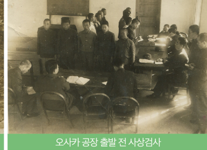
오사카 공장 출발 전 사상검사